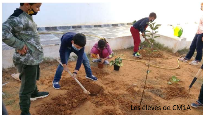
Les élèves de CM1A