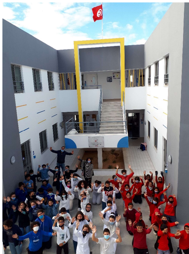
Tous en couleur : Bleu, Blanc, Rouge !